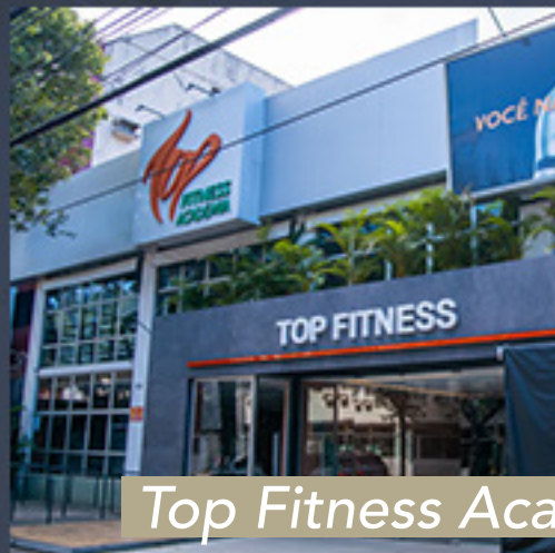
Top Fitness Academia