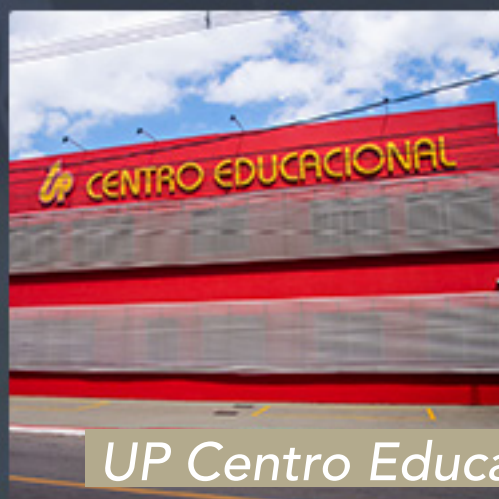
UP Centro Educacional